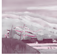
(このぼり) (絵の絵本) ©空想工房