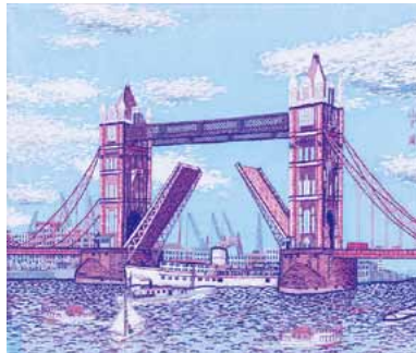
《ロンドンのタワーブリッジ》貼絵 1965年 ©清美社