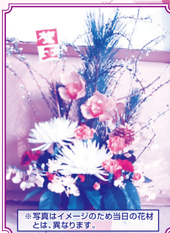
※写真はイメージのため当日の花材とは、異なります。