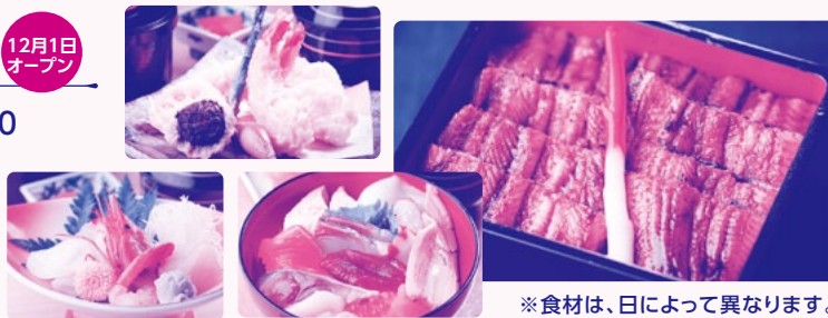
※食材は、日によって異なります。

場所 米子市東倉吉町90 電話 22-2570 営業時間 11:00～14:30 定休日 水曜日 ※要予約