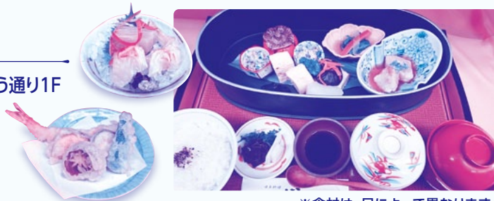
※食材は、日によって異なります。

場所 米子市東福原2-1-1 わこう通り1F 電話 38-5656 営業時間 11:30～14:00 定休日 第1月曜日 火曜日(祝日は営業)