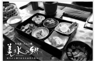
美水の郷 昼食特別メニュー(イメージ)

募集人員 40名(先着順) ※全行程、観光協会の職員が同行します。 申込期間 2010年3月25日(木)まで お問い合わせ先 米子市観光協会