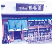
お茶の静香園 米子市米原 5-7-5 ☎33-6743

緑茶を飲むのは中国、日本、ベトナム、ミャンマーが主でイギリス、インド、アフリカでは紅茶を飲みます。世界では7割が紅茶と聞くと緑色のお茶は得体的しれない飲み物に見えるかもしれませんね。