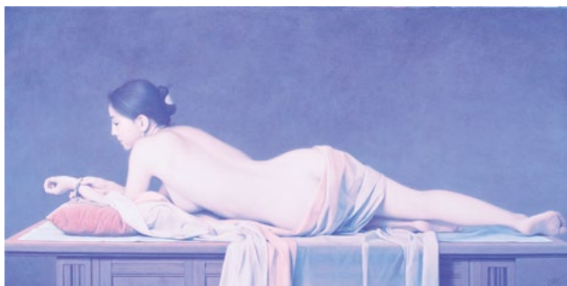
森本草介《横になるポーズ》1998年