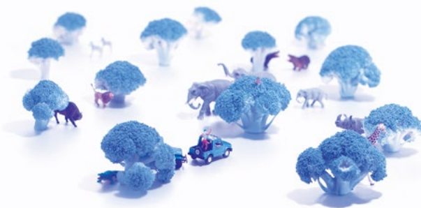
〈ブロッコリー1本分のサバンナ〉©Tatsuya Tanaka