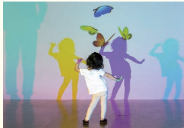
「色のある夢」藤本直明 © naoaki FUJIMOTO

会員料金 前売料金 1,100円 一般 800円 3歳以上 前売料金 500円 ～高校生 300円 ※3歳未満無料