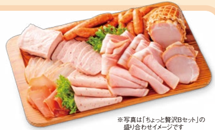
※写真は「ちょっと贅沢Bセット」の盛り合わせイメージです